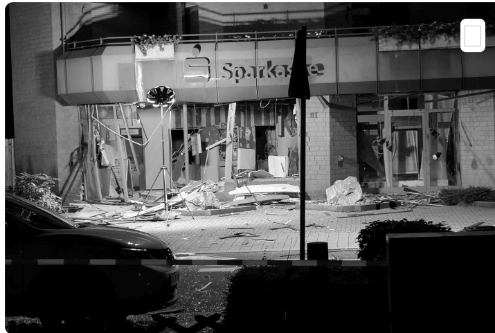
Die Sparkasse Bergkamen-Bönen hatte bis zuletzt mit der Sicherheit von Geldautomaten zu tun.