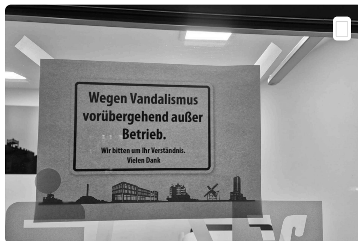
Die heimischen Geldinstitute hatten zuletzt eher mit Sicherheitsfragen in Bezug auf Geldautomaten zu tun, oder mit Vandalismusschäden.

Die heimische Sparkasse beruft sich darauf, dass man sich in Sicherheitsfragen an den Bundesnormen, Empfehlungen der Polizei und des Zentralverbandes der Sparkasse orientiere und „nicht unser eigenes Ding“ mache. „Egal, ob in der alten Filiale in Oberaden, hier oder im künftigen Neubau in Oberaden: Es ist überall der neueste Stand der Technik implementiert.“